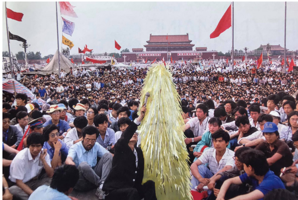
Porte-voix - posca sur magazine - 19 x 12 cm - 2021