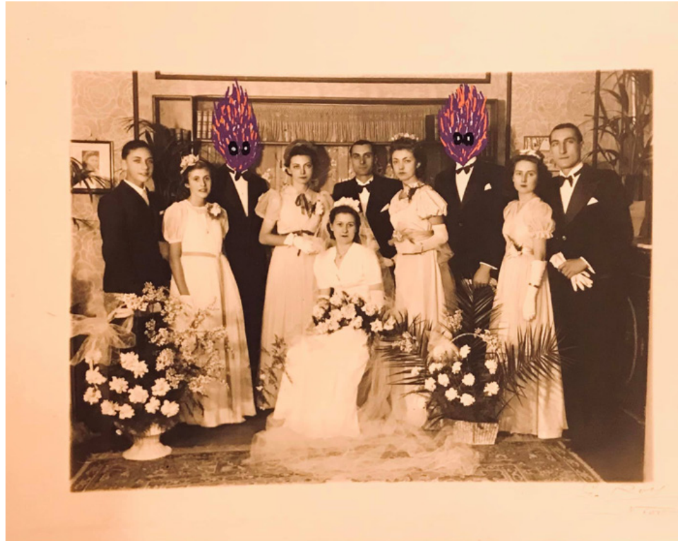
Les frères - posca sur photographie - 17 x 13 cm - 2021