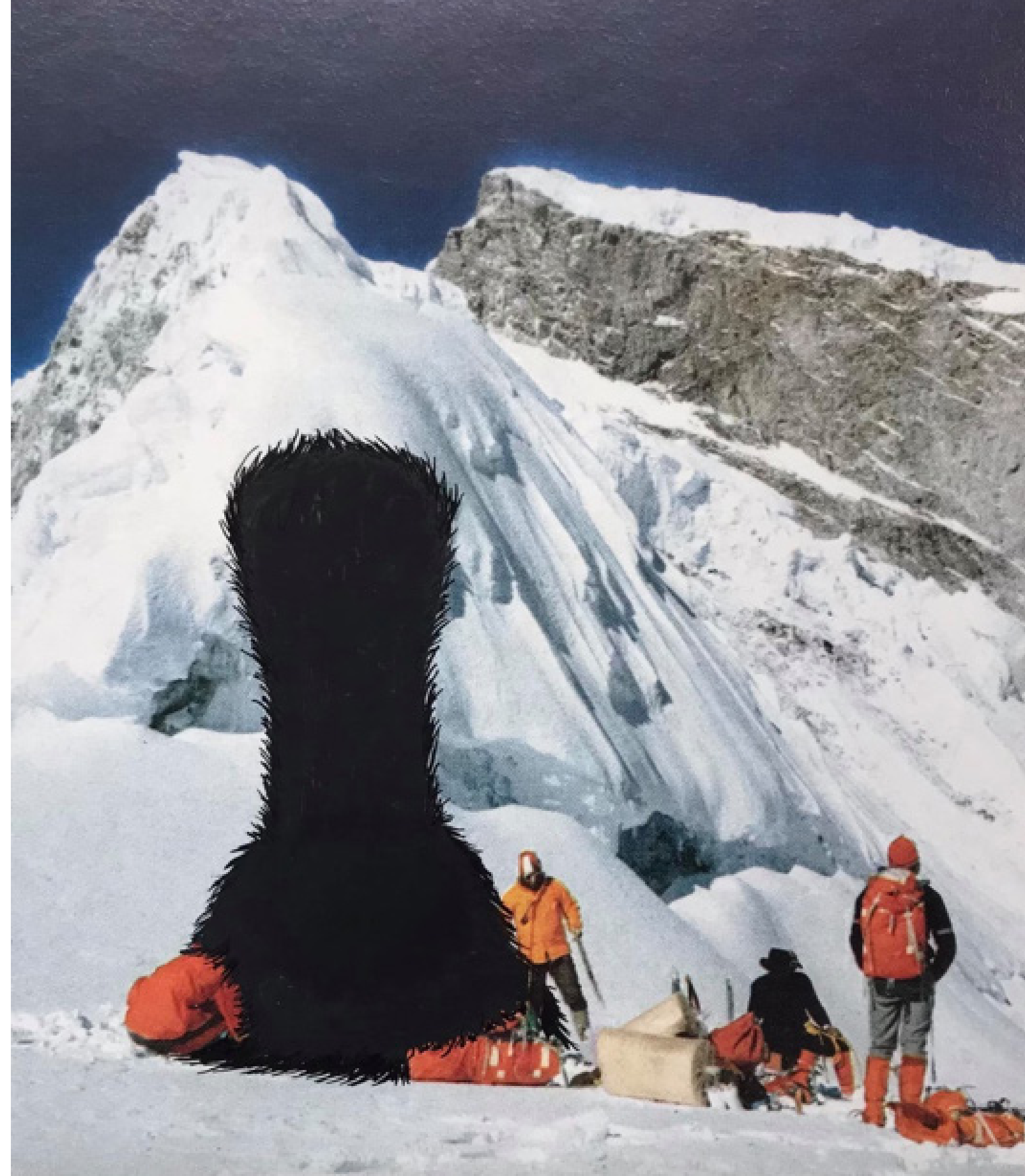
Le campement - encre sur magazines - 12 x 15 cm - 2021