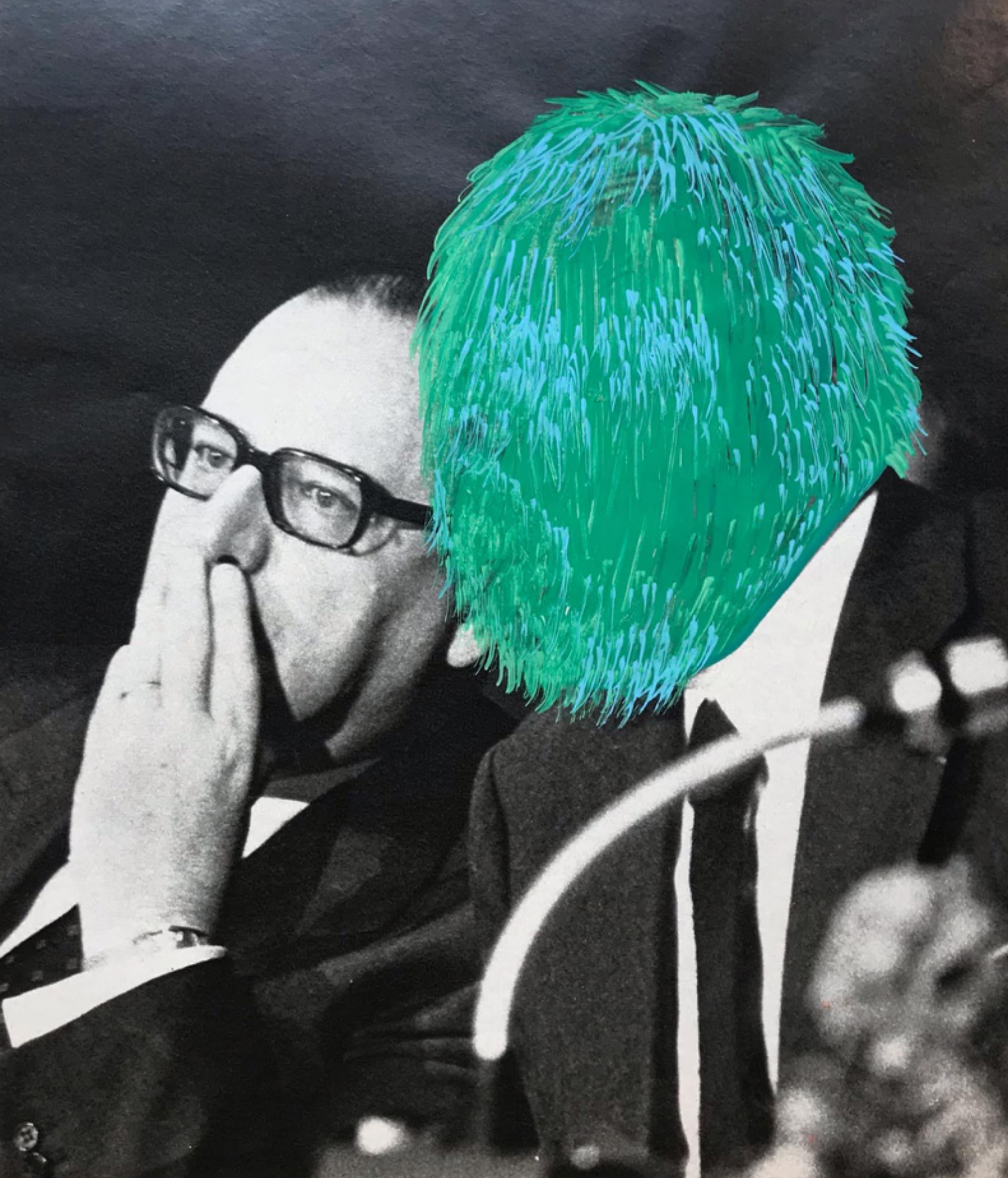
Séance de travail - Peinture et posca sur magazine - 15,5 x 17,5 cm - 2021