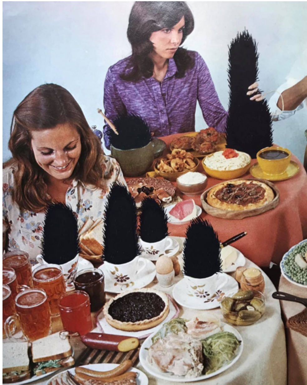
Le brunch - encre sur magazine - 20,5 x 25 cm - 2021